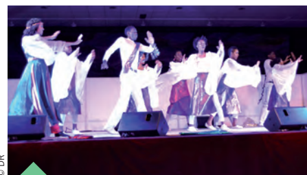
Les danses et chants du groupe : The day of Elijah .