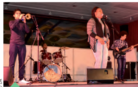
SOG , deux chanteuses et trois musiciens talentueux.