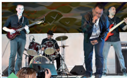
Le son métal du groupe Les rois de l'Évasion .