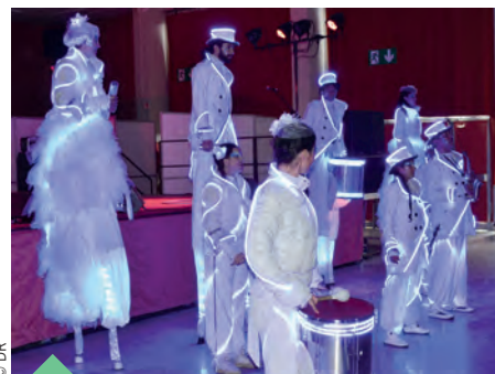
Musique, danse et lumières au son des percussions du groupe Tewhoola .

Dimanche 24 janvier dernier, ces artistes ont restitué leurs talents, lors d'une scène ouverte organisée au Théâtre Pierre-Fresnay. Retour sur ces Ermontois, tous plus incroyables les uns que les autres.