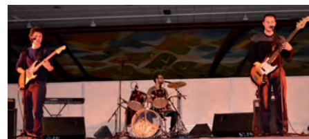
Le son rock vibrant d' Overmind .