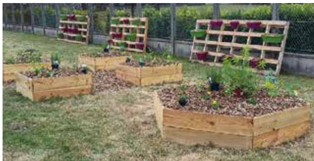
Le sentier nature avec les bacs potagers de Christophe

VOUS SOUHAITEZ EN SAVOIR PLUS ? Contactez Christophe à cette adresse : christopheroussel@me.com