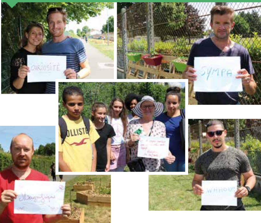
Les jeunes ont recueilli les premières impressions des passants.

ADJOINTE AU MAIRE CHARGÉE DE LA JEUNESSE, DES SPORTS ET DES CENTRES SOCIO-CULTURELS :