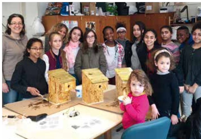
Les nichoirs fabriqués par les enfants du CMEJ

Le Conseil municipal d'enfants et de jeunes (CMEJ) a eu la volonté d'aménager une partie de la rue François-Moreau pour y observer la faune, y cultiver des fruits et légumes et s'y détendre. Lors du Forum Contributif, ils ont commencé par la fabrication de nichoirs. Résultats : une dizaine d'entre eux a été installée sur le « sentier nature » de la rue François-Moreau. Depuis, de nombreux autres aménagements sont venus agrémenter cet espace. Accompagnés de bénévoles et de services municipaux, les jeunes ont en effet posé des jardinières, planté des carrés potagers, créé un hôtel à insectes... Tout un écosystème de jardin qui permet aux curieux d'observer le cycle de vie des végétaux ou encore le travail des insectes pollinisateurs. Cet espace se veut également collectif et chacun peut participer à l'entretien du lieu.