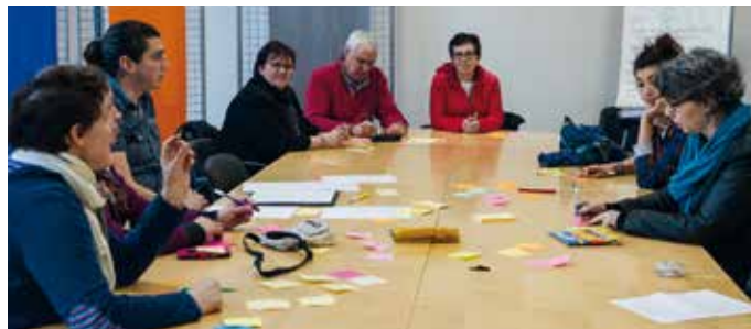
L'atelier « gaspillage alimentaire » porté par le magasin Cora Ermont

Dans un magasin comme Cora, la lutte contre toute forme de gaspillage alimentaire est un objectif majeur. Il existe plusieurs types de gaspillage : le gaspillage dû aux contraintes techniques (commandes, retrait de rayon des DLC* courtes...) et le gaspillage lié au comportement des clients, notamment à l'abandon des produits frais en magasin et cassure de la chaîne du froid.