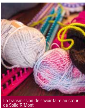
La transmission de savoir-faire au cœur de Solid'R'Mont