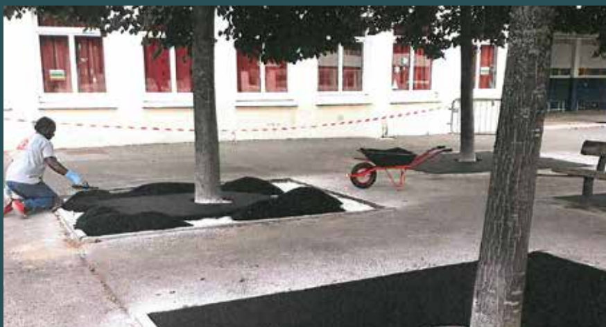
Pose de sols souples drainants aux pieds des arbres dans toutes les cours d'écoles pour leur protection.