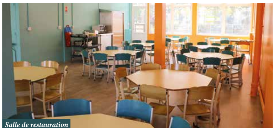
Salle de restauration