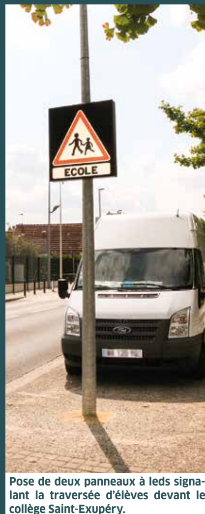
Pose de deux panneaux à leds signalant la traversée d'élèves devant le collège Saint-Exupéry.

De plus, les systèmes de sécurité incendie ont été remplacés dans les Groupes scolaires Victor-Hugo 1 et 2, et Alphonse-Daudet. La toiture du Groupe scolaire Victor-Hugo 2 a été reprise.