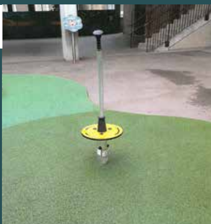
Installation de nouveaux jeux dans la cour d'école maternelle Jean-Jaurès.

De plus, les systèmes de sécurité incendie ont été remplacés dans les Groupes scolaires Victor-Hugo 1 et 2, et Alphonse-Daudet. La toiture du Groupe scolaire Victor-Hugo 2 a été reprise.