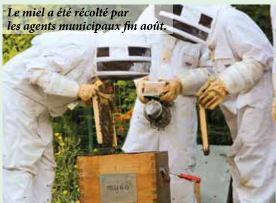
Le miel a été récolté par les agents municipaux fin août.

Les pots de miel 2018 sont en vente auprès du Service municipal du Développement Durable (Mairie principale) au prix de 1,50 € le pot de 125 grammes. Les quantités à l'achat sont limitées à 2 pots par personne (dans la limite des stocks disponibles) car la récolte est moins importante cette année. Les mauvaises conditions météorologiques ainsi que la présence de frelons asiatiques expliquent notamment cette baisse de productivité.