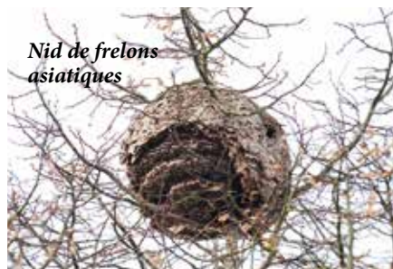
Nid de frelons asiatiques

N'essayez pas d'intervenir vous-même. Contactez un référent frelon asiatique qui confirmera ou non qu'il s'agit bien de cette espèce et vous indiquera la procédure à suivre pour assurer sa destruction.