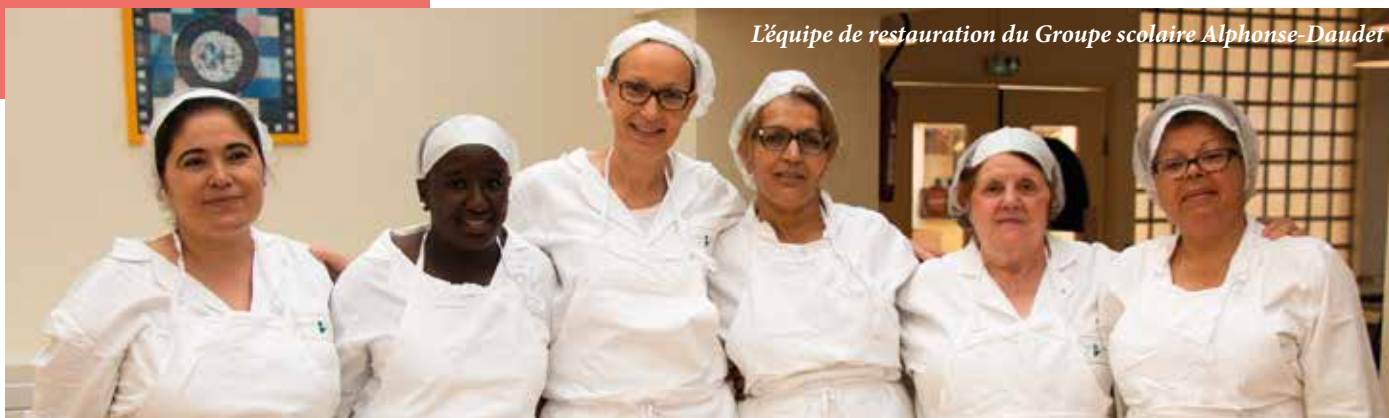
L'équipe de restauration du Groupe scolaire Alphonse-Daudet