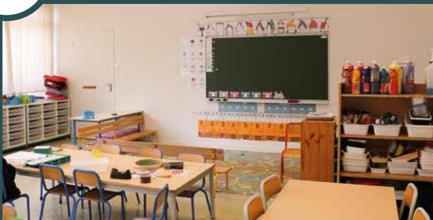
Rénovation de quatre classes et du système de chauffage dans le Groupe scolaire Maurice-Ravel.